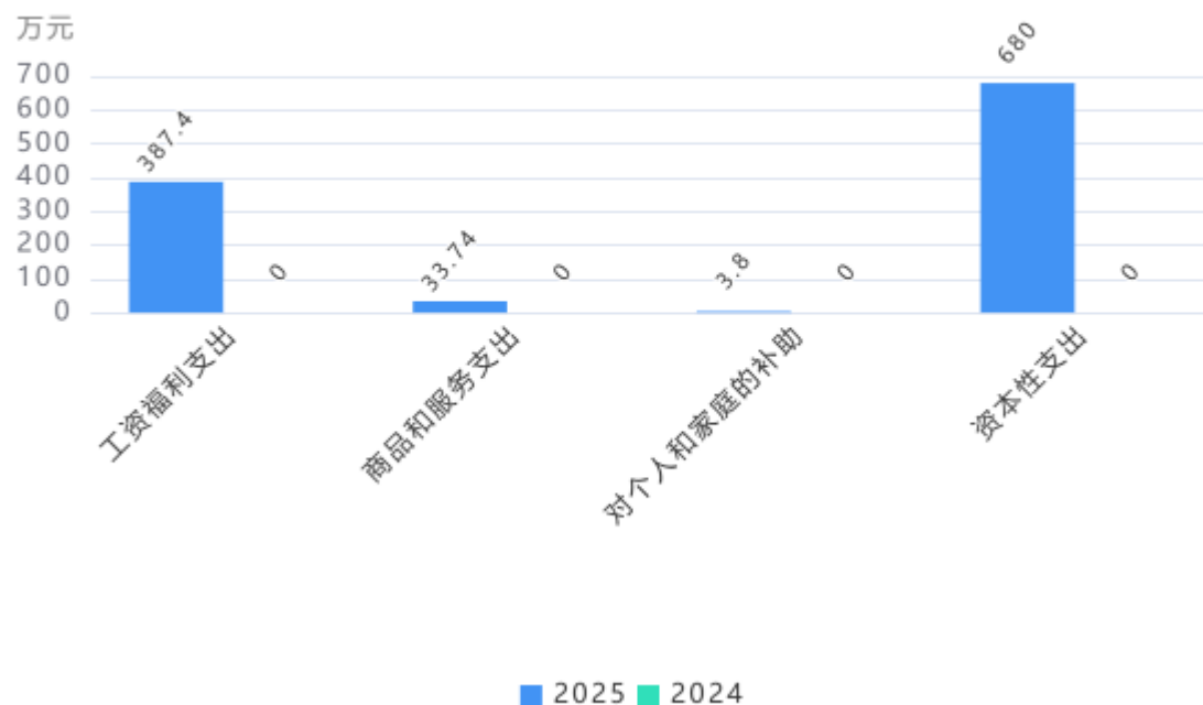
支出按部门预算支出经济分类对比图

2. 按照政府预算支出经济分类，本单位当年一般公共预算支出1,104.94万元，其中：