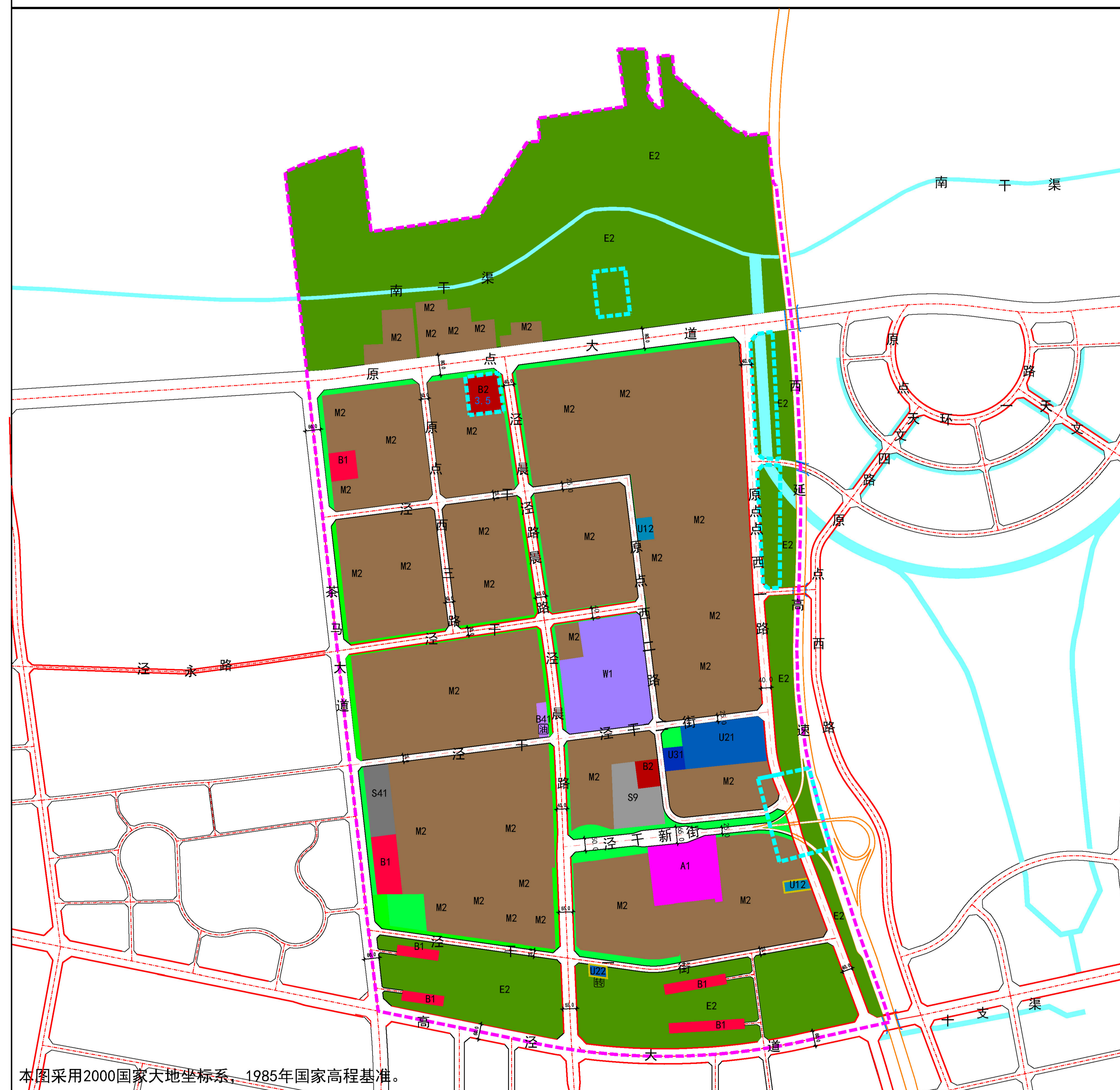
XXJH-JG02管理单元土地利用规划图（修改前）