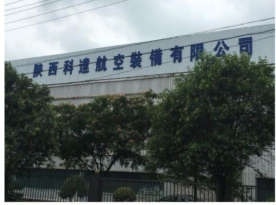
南侧隔路陕西科达航空装备有限公司