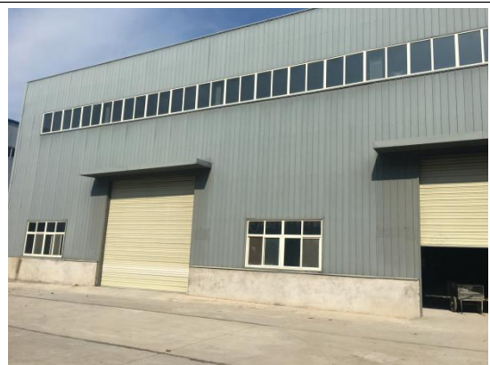
车间北侧陕西西高开关有限公司闲置车间