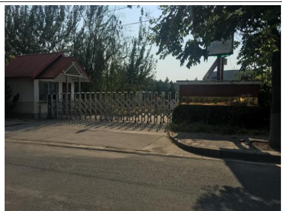
北侧陕西中建电力工程有限公司