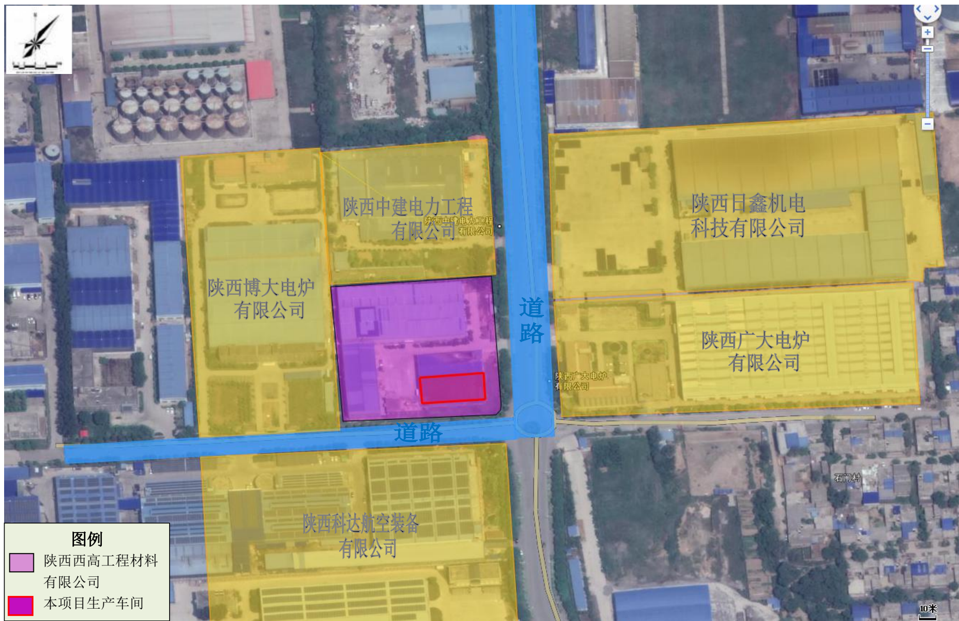
附图2 项目四邻关系图