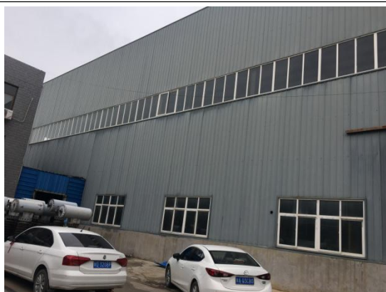
车间西侧陕西西高开关有限公司组装车间