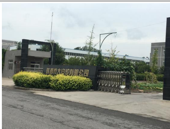
西侧陕西博大电炉有限公司