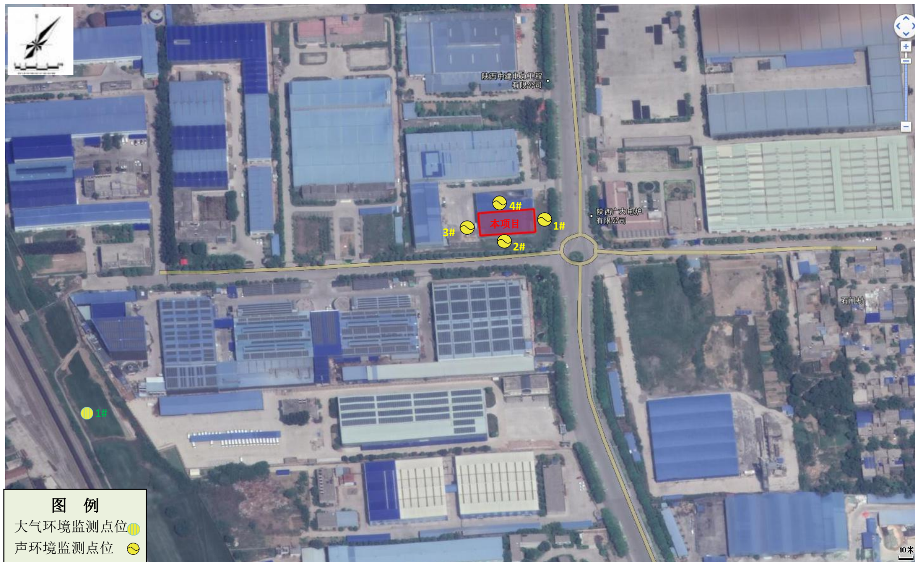
附图5 现状监测点位图