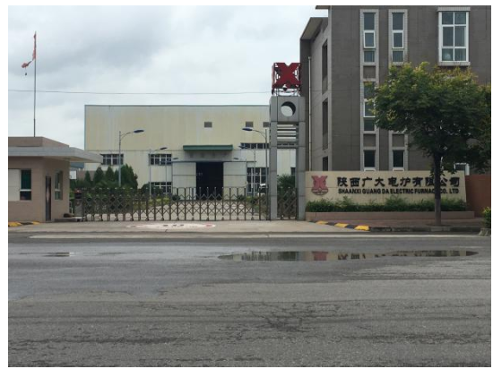
东侧隔路陕西广大电炉有限公司