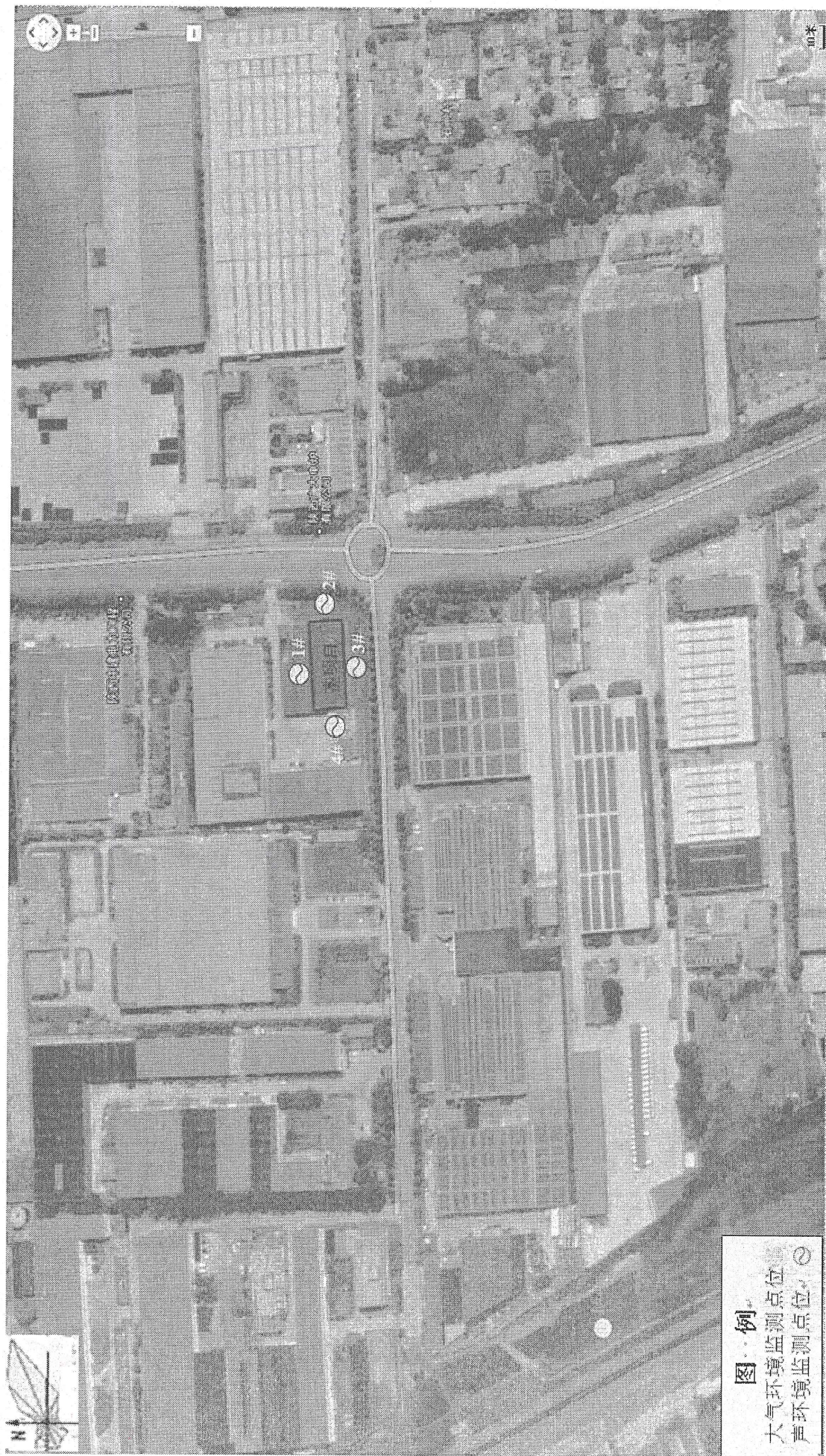
图·例 大气环境监测点位 声环境监测点位