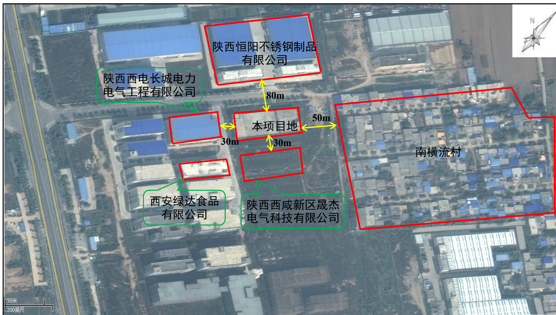
附图二 项目四邻关系