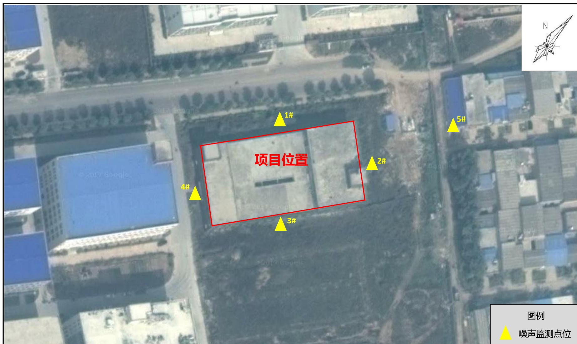
附图五 噪声监测点位图