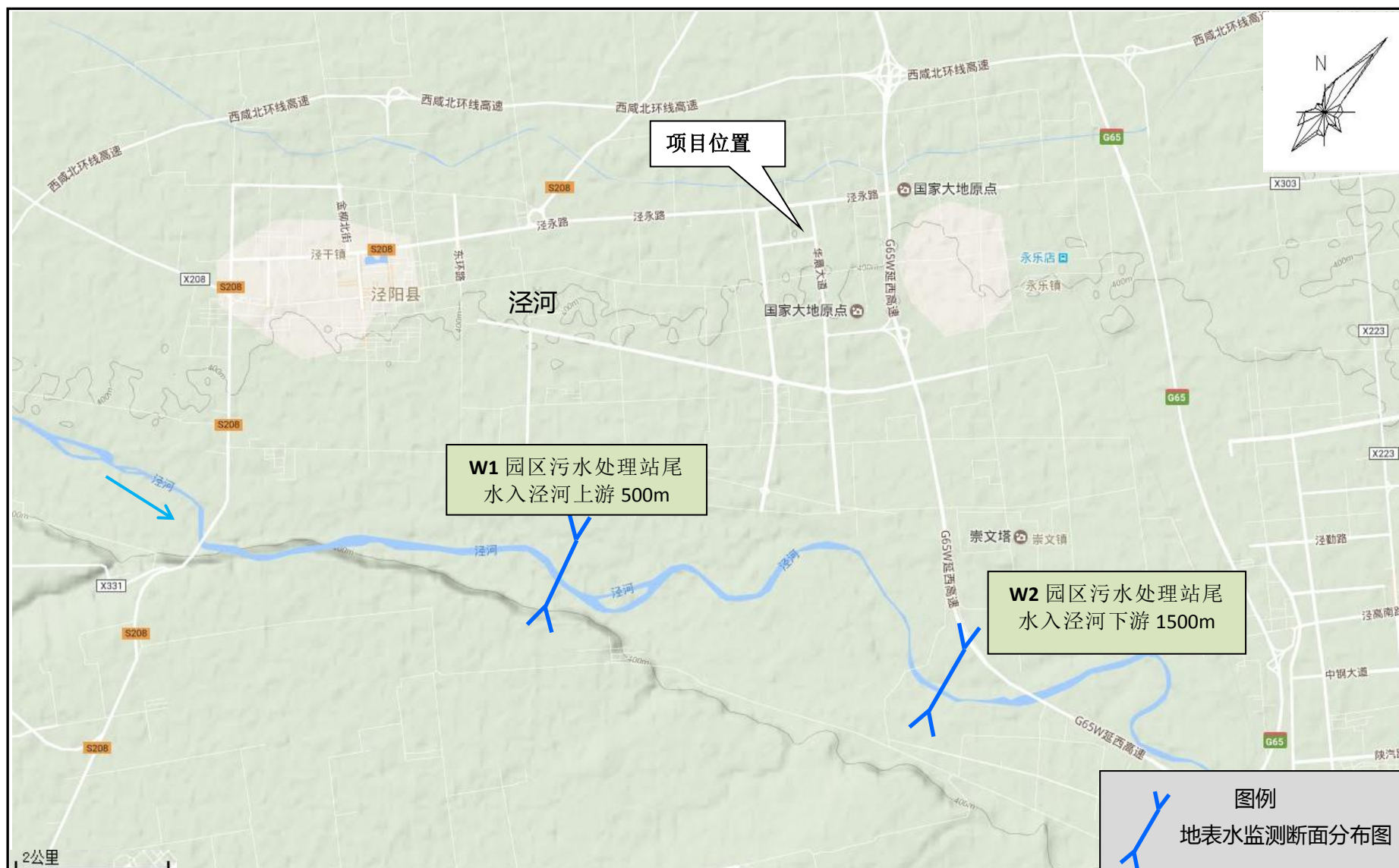
附图四 引用地表水监测断面分布图