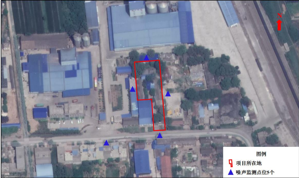
图 2 噪声监测点位图

由表 12 监测结果可知,本项目所在地厂界四周及南侧居民点昼间和夜间噪声监测值均满足《声环境质量标准》(GB3096-2008)3 类标准。