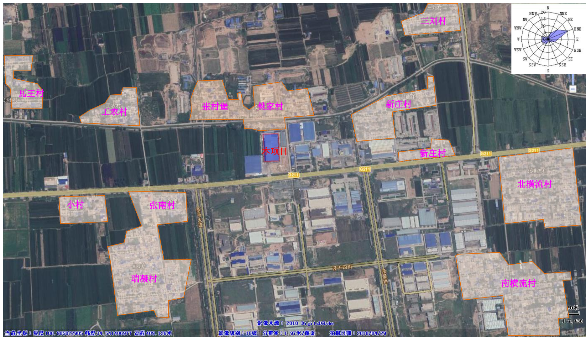
附图4 项目敏感保护目标图