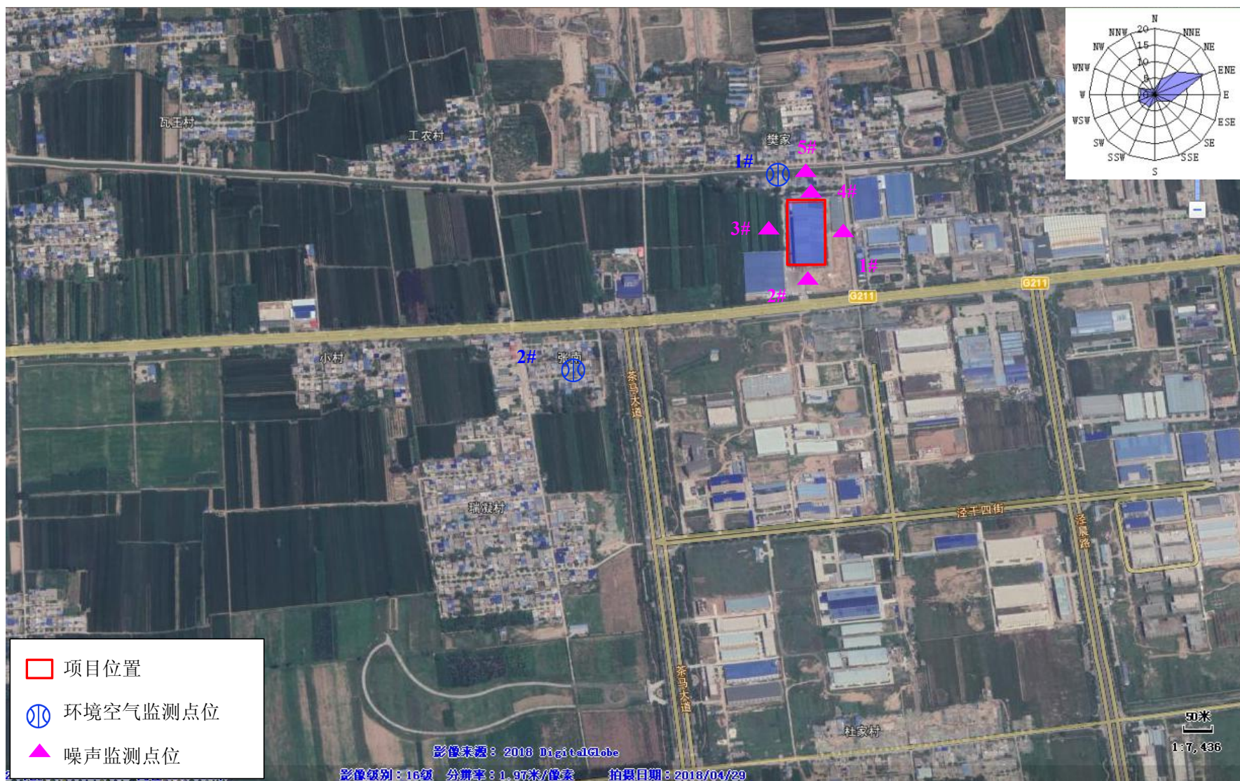
附图5 大气、噪声监测点位图