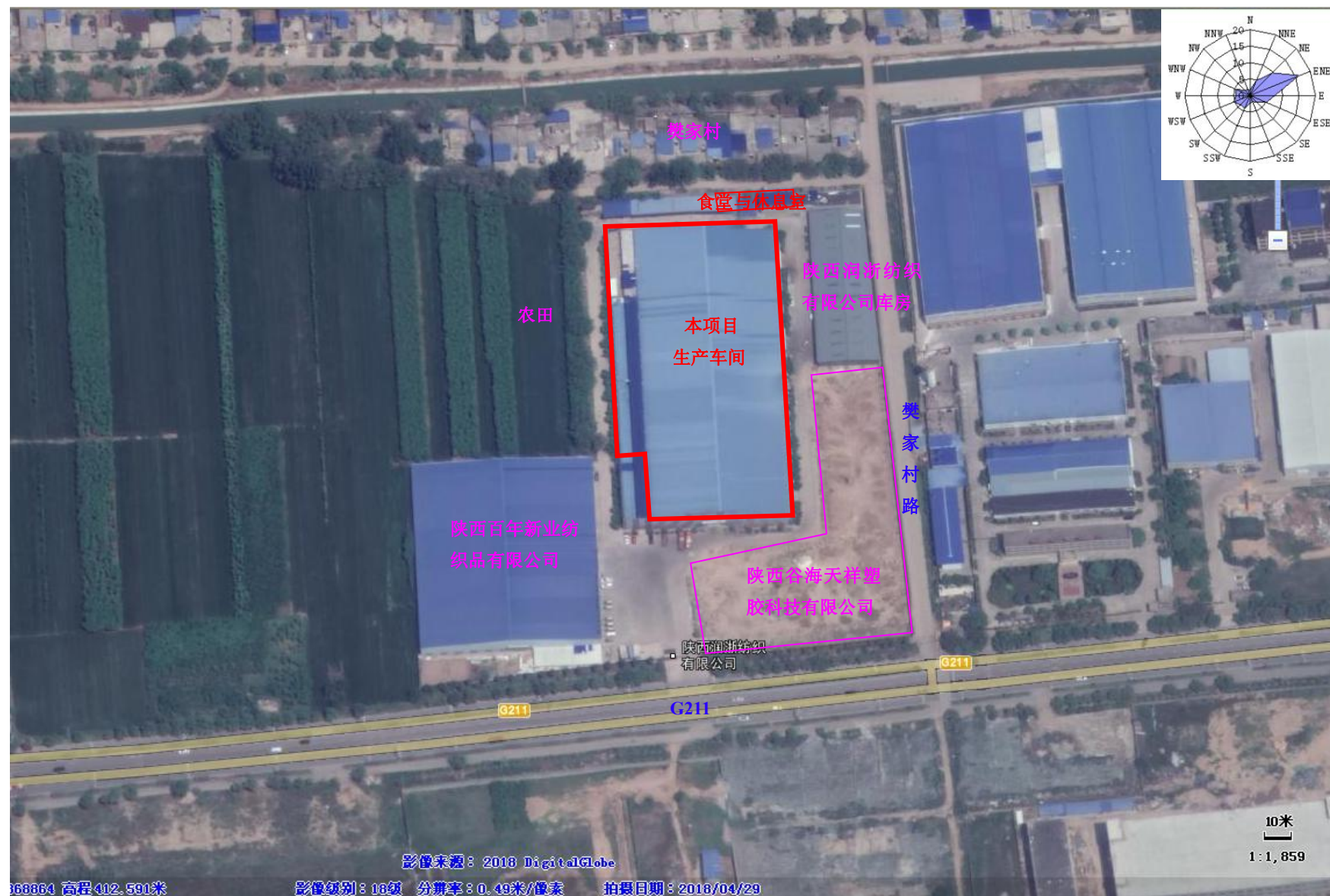
附图3 项目四邻关系图