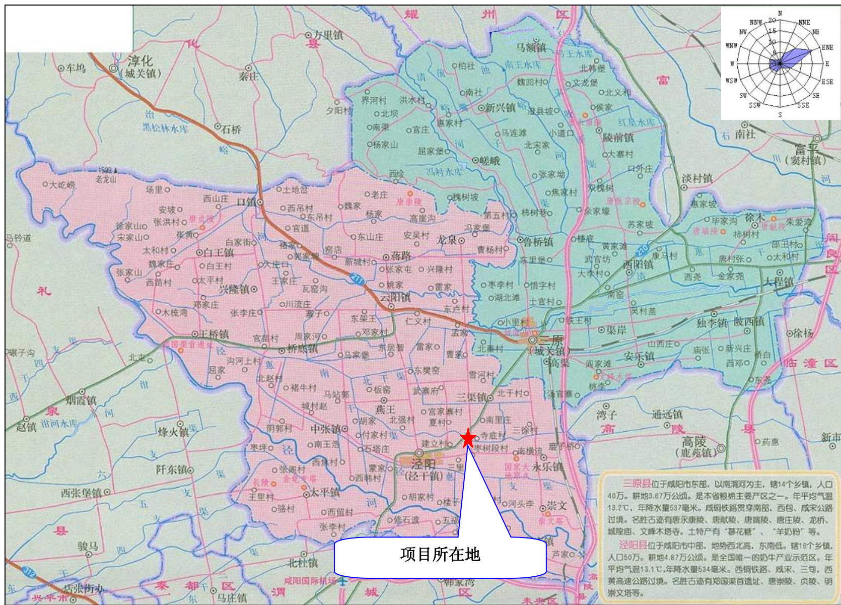
附图1 项目交通位置图